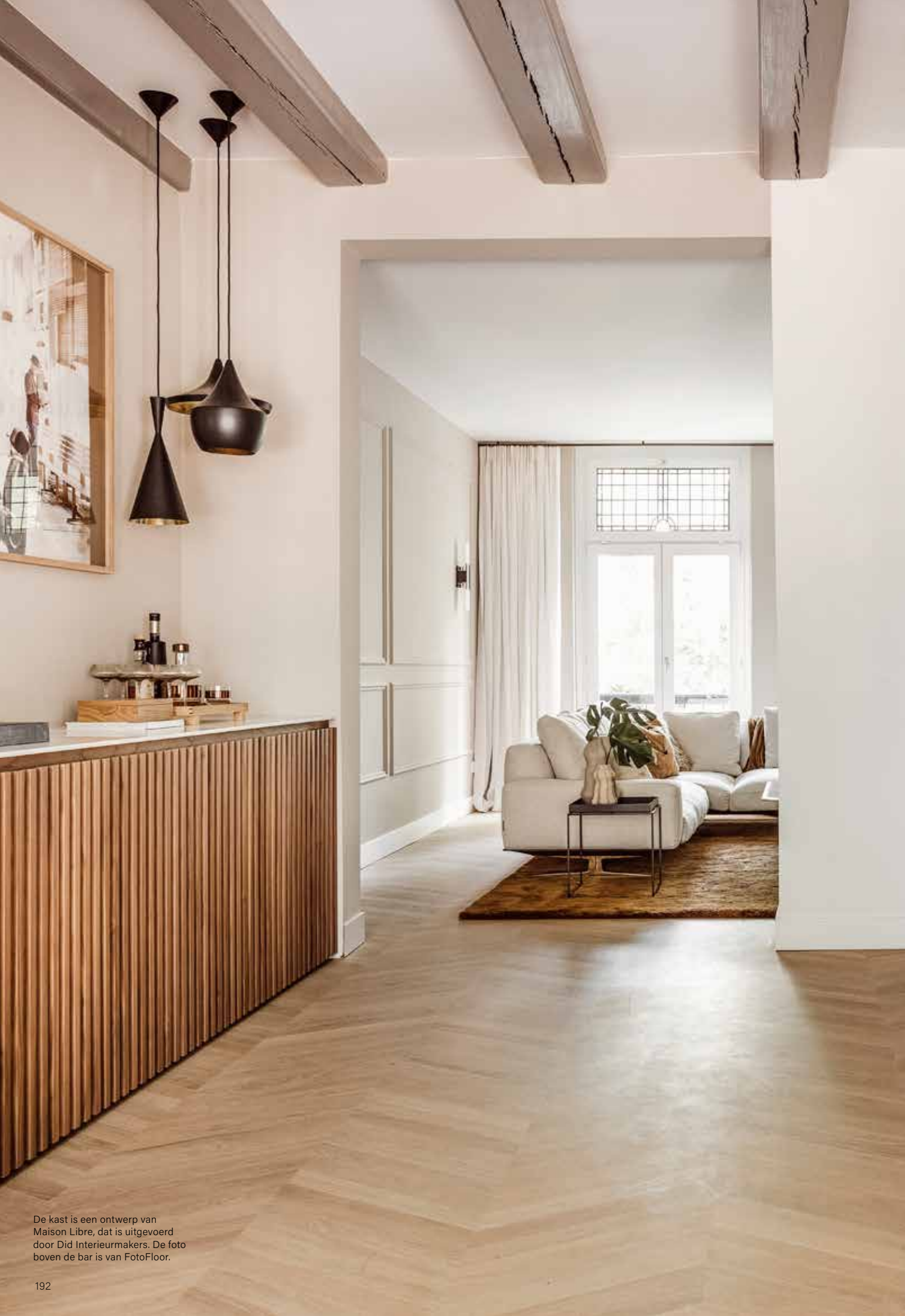
De kast is een ontwerp van Maison Libre, dat is uitgevoerd door Did Interieurmakers. De foto boven de bar is van FotoFloor.