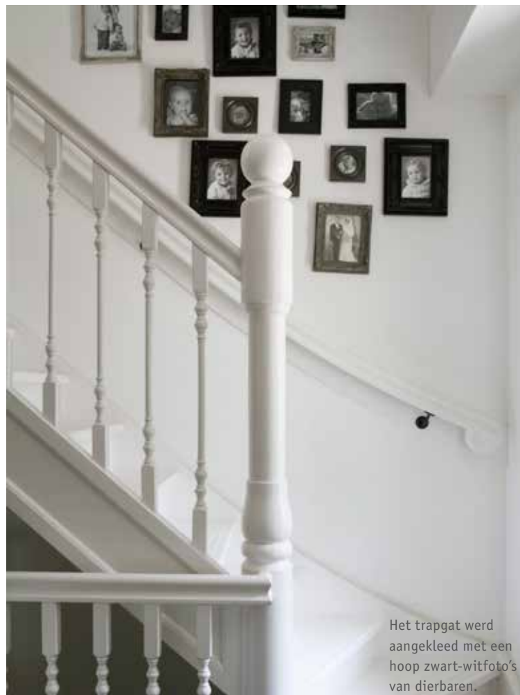
Het trappgat werd aangekleed met een hoop zwart-witfoto's van dierbaren.